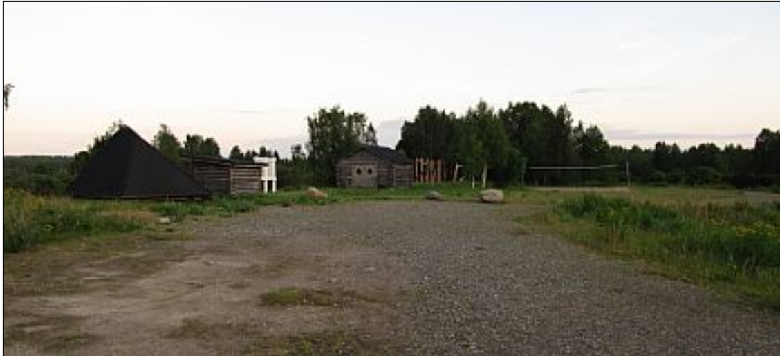
Kuva 3. Yleisilme Hirvasojan virkistysalueelta.