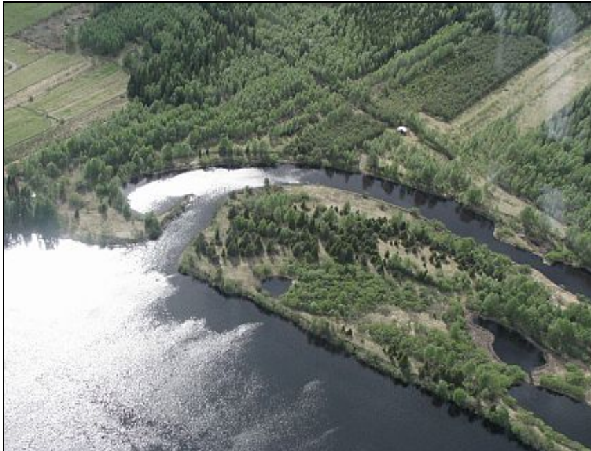
Kuva 7. Luonnoltaan vaihtelevaa Hirvasojaa.

läyhdistyksen arkistossa. Kemijokiyhtiö on myötämielinen hankkeelle, mutta voi kirjoittaa sopimuksen Hirvaan kyläyhdistyksen edustajan kanssa sen jälkeen, kun Rovaniemen kaupunki ja Hirvaan kyläyhdistys ovat sopineet luontopolun ja ulkoilureitin hoitovastuista. Kemijokiyhtiön maanomistukset ovat nähtävissä liitteessä 3. Rovaniemen kaupungin virkamiehiin on vielä oltava yhteydessä kaupungin maille tulevasta luontopolusta.