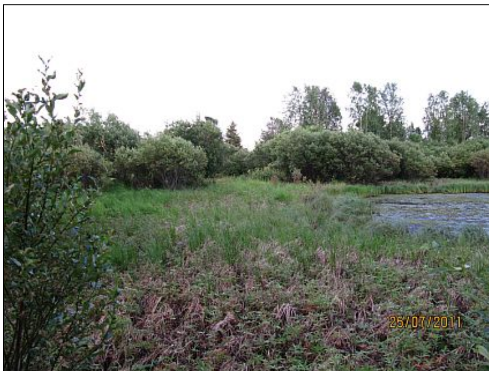
Kuva 11. Osa luontopolusta tarvitsee pitkospuita.