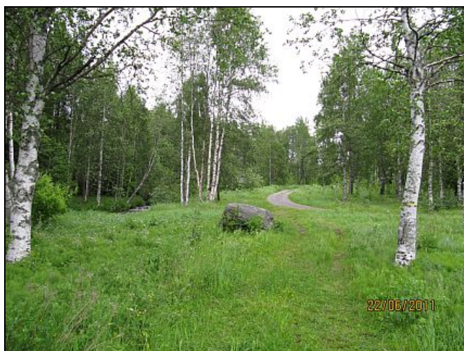
Kuva 20. Ennen talkoita.

Tuomiojan virkistysalueen kehittämistavoitteista osa on kulkenut käsi kädessä toteutuksen kanssa. Kesällä 2011 alueella on tehty raivauksia, joilla aluetta on saatu siistimmäksi ja kohdennettua tuleva tulisijan paikka törmän päälle ja parkkipaikka Nelostien varteen. Tuomiojan virkistysalueelle suunnitellut ja toteutettavat toimenpiteet näkyvät Heli Rapakon piirtämässä asemapiirroksessa (Liite 5). Kesän 2011 aikana alueella on niitetty talkoovoimin (Liite 6) pitkä heinä alas ja siistitty ruohonleikkurilla, kaadettu puita ja rajattu nuotio- ja parkkipaikat.