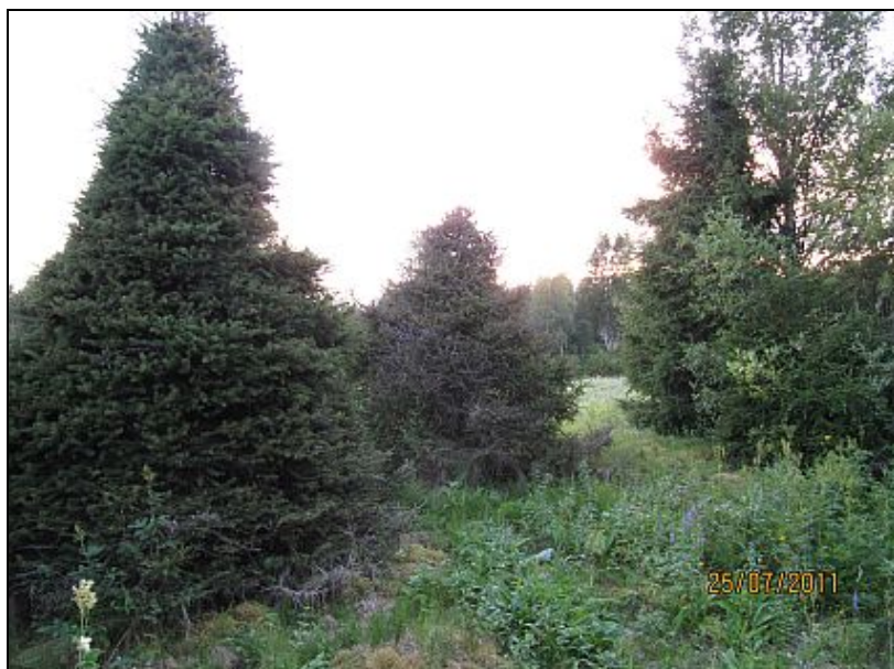
Kuva 9. Menninkäiskuusia.