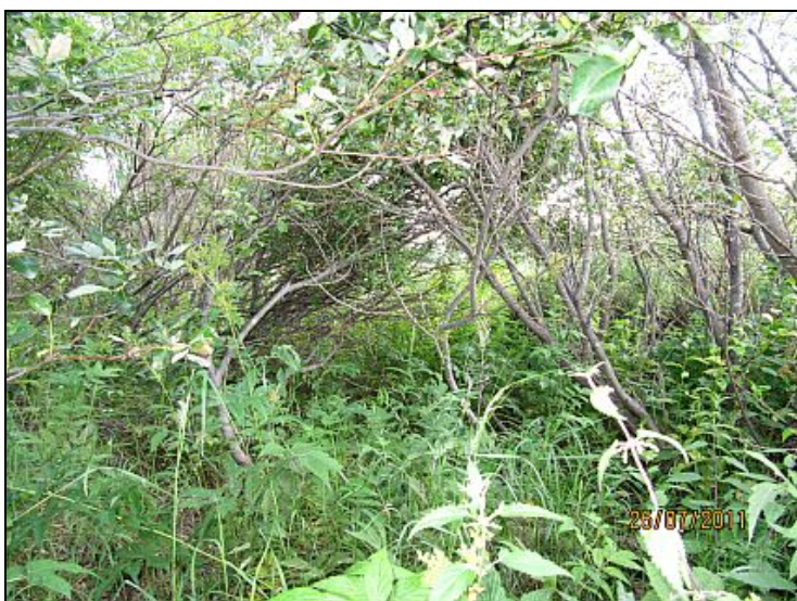
Kuva 14. Raivattavaa pajukkoa.