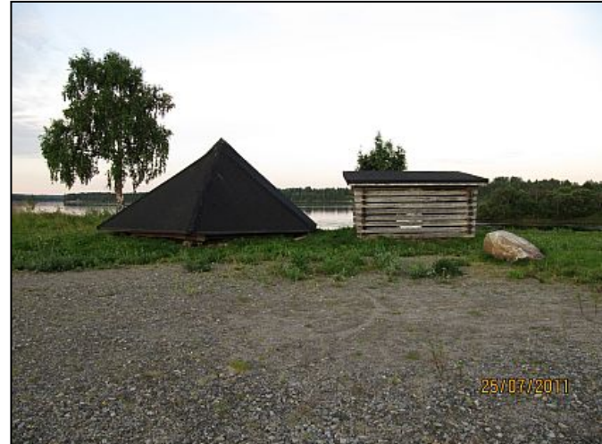
Kuva 6. Laavu peittää maiseman.

Pukukoppi-kioskirakennus tullaan siirtämään vuoden 2012 aikana Tuomiojan virkistysalueelle. Vessat jäävät paikoilleen. Leikkitelineet olisi myös hyvä säilyttää Hirvasojan virkistysalueella, koska Tuomiojan virkistysalueen päässä kylää on päiväkodin pihalla uusi laadukas leikkikenttä. Hirvasojan virkistysalueen beach wolley -kenttäkin voisi pysyä paikallaan. Se tarvitsisi kuitenkin uutta pehmeää hiekkaa. Kentällä on ollut käyttäjiä myös muista kylistä. Sen käyttäjämäärää on kuitenkin vaikeaa arvioida. Esimerkiksi muurolalaiset nuoret kehuivat kenttää ja sen siisteyttä. Ideoinnissa tuli esille myös koirapuisto, jonka voisi maanomistajan antaessa luvan sijoittaa laavulta parkkipaikalle päin.