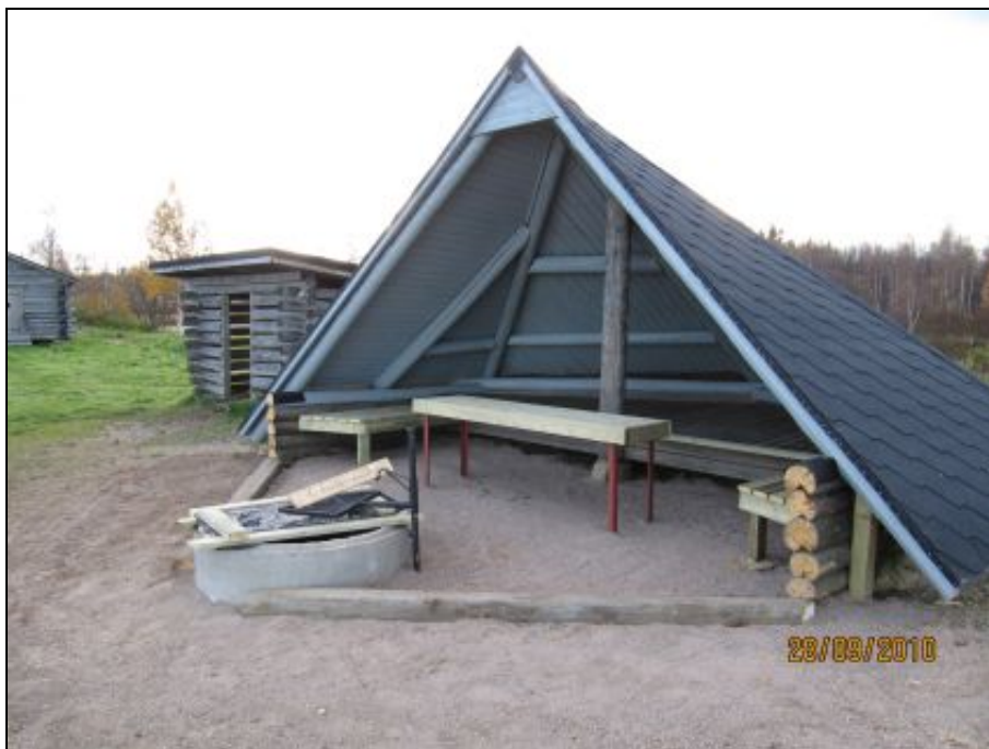
Kuva 15. Vastakunnostettu laavu.

Hirvasojan virkistysalueella on esiintynyt myös häiriökäyttäytymistä ja rakennukset ovat kokeneet ilkivaltaa. Alueelle olisikin hyvä hankkia esimerkiksi riistakamera, joka dokumentoisi tapahtuneen ilkivallan. Riistakameran olemassaoloa ei tarvitse ilmoittaa alueen käyttäjille, mikä olisikin parempi, ettei se joudu ilkivallan kohteeksi.