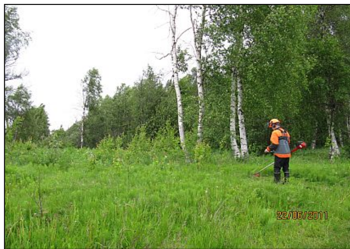
Kuva 21. Talkoissa.