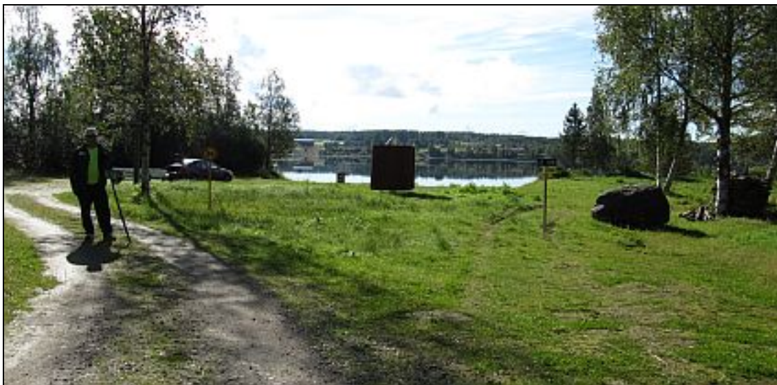
Kuva 24. Koiramerkit.