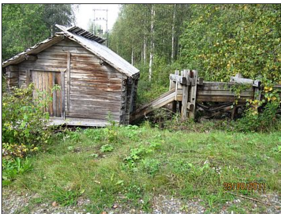
Kuva 23. Raivauksen jälkeen paljastunut kunnostusta kaipaava mylly.

Tulisijan istuimet sekä valumavesien ohjausparrut tulevat paikoilleen kuluvana syksynä. Ohjausparruihin rakennetaan myös neljä kiinteää retkipöytää tuoleineen, joten alueen virkistyskäyttöaste paranee. Pukukoppi-kioskirakennuksen siirto Hirvasojan virkistysalueelta Tuomiojan virkistysalueelle sekä kompostikäymälän ja beach wolley- kentän rakentaminen ja ojien perkkkaus tapahtuvat kesällä 2012. Eräs nuori poika ehdotti pukukoppi-kioskirakennukseen jopa yleistä saunaa. Tuomiojan myllyn kunta pyrkii saamaan vuoden 2012 YTY- kohteeksi eli ympäristönsuojelua ja -hoitoa edistävän hanketyön kunnostus- rakentamiskohteeksi. Myllyn yhteyteen tulisi saada myös infotaulu, josta näkee rakennuksen käyttötarkoitus ja historiaa.