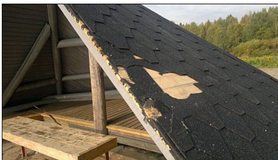
Kuva 16. Laavu ilkivallan jälkeen.