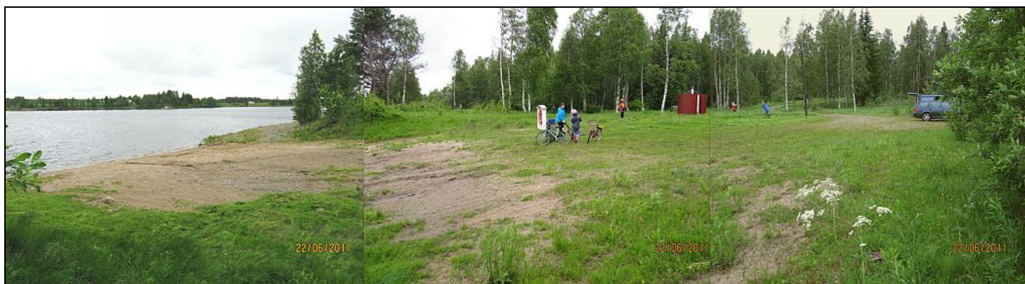
Kuva 18. Tuomiojan virkistysaluetta.

Hirvaan Tuomiojan virkistysalueella on parhaimpaan kesäaikaan viitisenkymmentä käyttäjää päivässä. Alueen vakituiset käyttäjät ovat toivoneet alueen siistimistä ja palveluiden parantamista. Uudistettaviksi asioiksi ovat nousseet nykyistä paremmat pukukopit ja vanhan poisvienti, virallinen nuotiopaikka, ulkovessat, retkipöytä, beach-kenttä, koirille erillinen uittamisalue, veneille rantaan nousupaikka ja virallinen parkkipaikka uimapaikalle. Lisäksi uimapaikalle on toivottu enemmän hiekkaa ja valumavesien ohjausta, jottei uimapaikan hiekka valu jokaisen rankkasateen ja kevään sulavesien jälkeen jokeen (Liite 4).