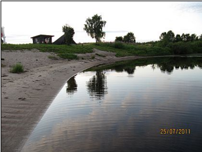
Kuva 5. Laavun edessä on hyvin vähän oleskelutilaa.