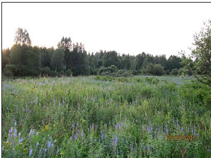
Kuva 12. Rantaniitty.