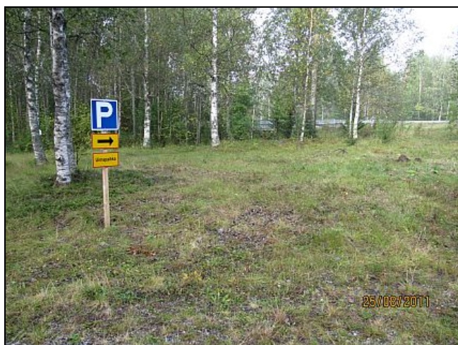
Kuva 25. Uimapaikan parkkipaikka.