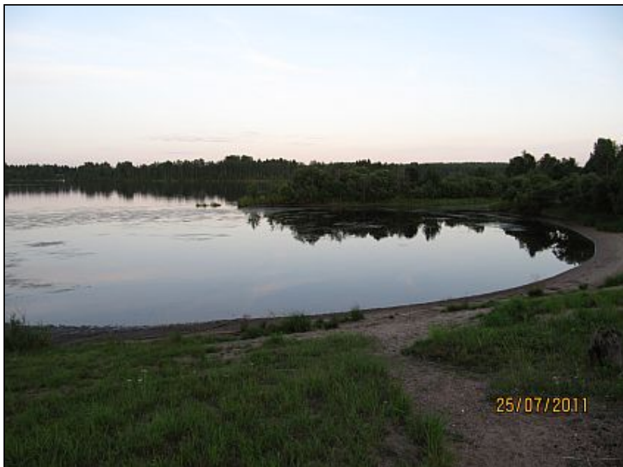
Kuva 4. Maisema laavulta.