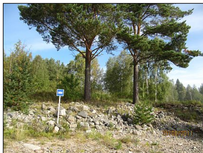
Kuva 26. Veneennousupaikka.