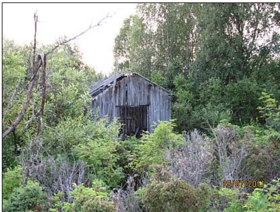
Kuva 8. Hirvasojan virkistysalueen ainoa pystyssä oleva lato.