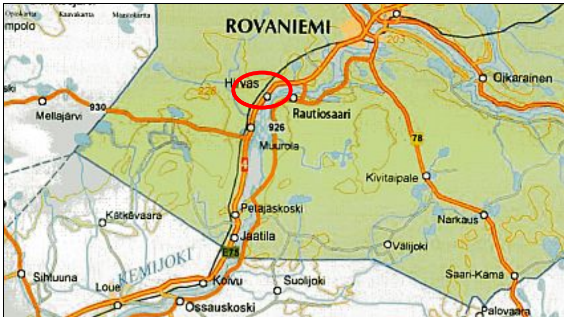
Kuva 1. Hirvaan kylän sijainti Rovaniemen kaupungissa.