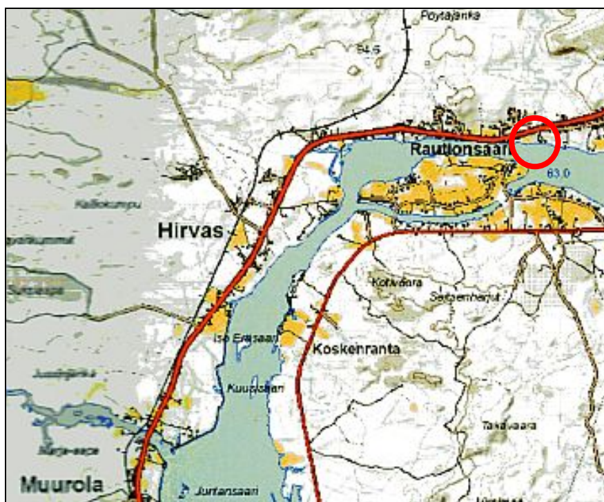
Kuva 17. Tuomiojan virkistysalue.

Tuomiojan virkistysalue sijaitsee Hirvaan kylän pohjoispäässä, Häkinvaaran alapuolella, Kemijoen rannassa. Tuomioja on ollut historiansa aikana kylän toimintoja kokoava alue: Siellä sijaitsevassa kylän mylly on jauhettu koko kylän jauhot. Mylly on ollut osuuskuntaperusteinen. Myöhemmin alueella on toiminut leirintäalue, jonka yhteydessä on ollut kioski. Alueen välittömässä läheisyydessä on toiminut aikoinaan myös kauppa. Nykyisin Tuomiojan virkistysalue on yksi kaupungin virallisista uimapaikoista.