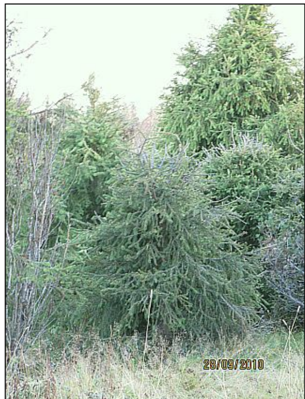
Kuva 10. Yksi heistä. Vai meistä?