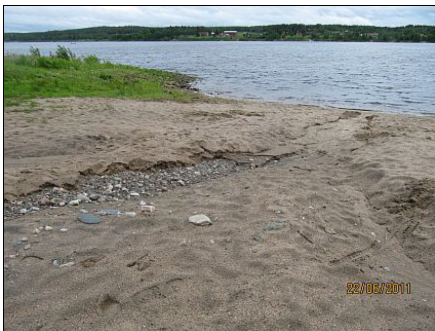
Kuva 19. Valumavesien muodostamia uomia.