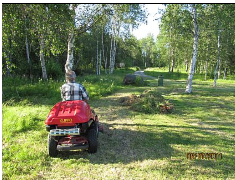
Kuva 22. Talkoiden tulosta.