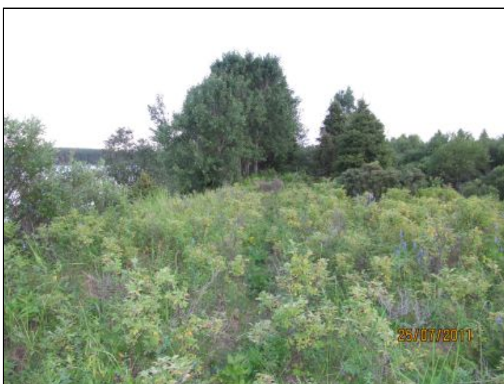
Kuva 13. Raivattavaa ruusupensaikkaa